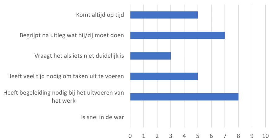
Figuur 2. Werkrelevante eigenschappen coachees bij start coachingstraject

Uit de antwoorden op deze vraag blijkt dat de jongeren volgens hun ouders niet snel in de war raken tijdens werkzaamheden, maar wel baat hebben bij begeleiding tijdens het uitvoeren van hun werk.