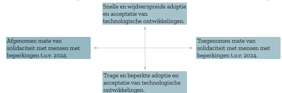
Figuur 3: Assenkruis – mate van adoptie en acceptatie van technologische ontwikkelingen en mate van solidariteit met mensen met beperkingen

Deze beide kernonzekerheden vormen de assen waar langs de scenario's ontwikkeld zijn (zie Figuur 3).